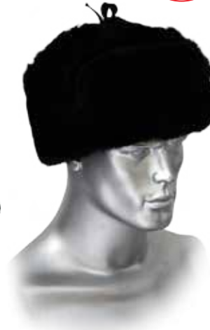
ШАПКА-УШАНКА (МУТОН ИСКУССТВЕННЫЙ) 02752 черная

Классическая модель трансформер. Мех: мутон искусственный Подкладка: вискозно-полиэфирная. Утеплитель: ватин, п/ш.