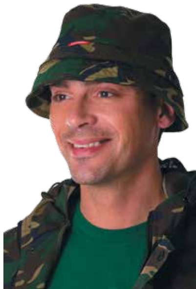
ПАНАМА "РЫБОГОВ" 09981 хаки 07589 КМФ «Лес»

Противомоскитная сетка убирается в поля. Низ сетки регулируется эластичной тесьмой с фиксатором.