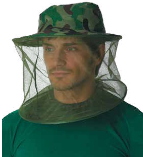
ПАНАМА С ПРОТИВОМОСКИТНОЙ СЕТКОЙ 65785 КМФ «Лес»

Предназначена для защиты от насекомых, сетка фиксируется металлическим обручем по полям панамы и низу.