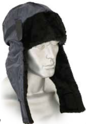
ШАПКА-УШАНКА «ЕВРО» 00406 темно синяя

Ткань подкладочная: «Таффета»; состав: 100% - п./э., ширина 150 см. Цвет синий. Размеры: 54-56, 57-59, 60-62 ОСТ 17-635-87