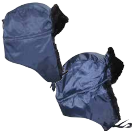
ШАПКА УШАНКА «ПЮКС». 03567 синяя (ткань «Оксфорд») 03575 синяя (ткань смесовая)

Шапка-ушанка: козырек и уши на искусственном меху, внутренняя часть шапки на подкладке с синтепоном, на затылке - кулиса со шляпной резинкой и стопором для регулировки объема. Застежка шапки - завязки.