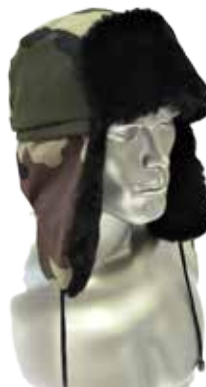
ШАПКА-УШАНКА "ОХОТА" 07553 КМФ «Дубок» 07555 КМФ «Зима» 00216 КМФ «НАТО»

Ткань: «Оксфорд», 100% п./э. Утеплитель: «Синтепон» пл.150 гр/м 2 , (1 слой). Мех мутон искусственный, черный, серый. Подкладка: «Флис» 100% п./э. Размеры: 54-56, 57-59, 60-62 ОСТ 17-635-87